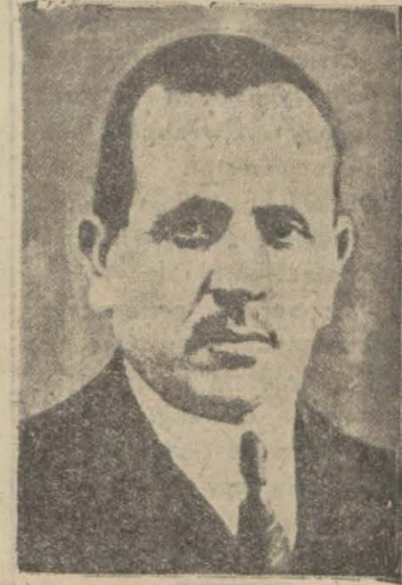
Eskişehir Meb'usu Emin B.