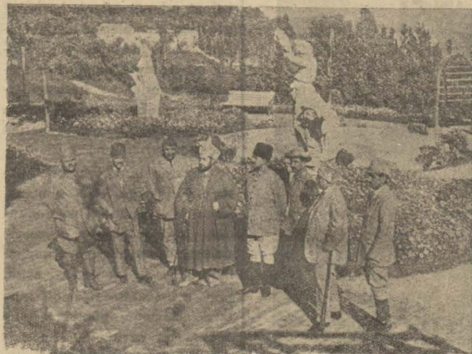
Pagma sarayı bahçesinde Emanullah han İnaçettullah hanla beraber terketmesine Harbiye nazırların sebep olduğunu anlatıdan gördüğü kaba muamele-

bil,, de uğradığı ademi muvaffakiyetleri hep Harbiye nazırından bilirdi. Bizce bu hususta haksızdı. Fakat vaziyet icabı bu haksızlıkta ısrar etmesi lâzımdı.