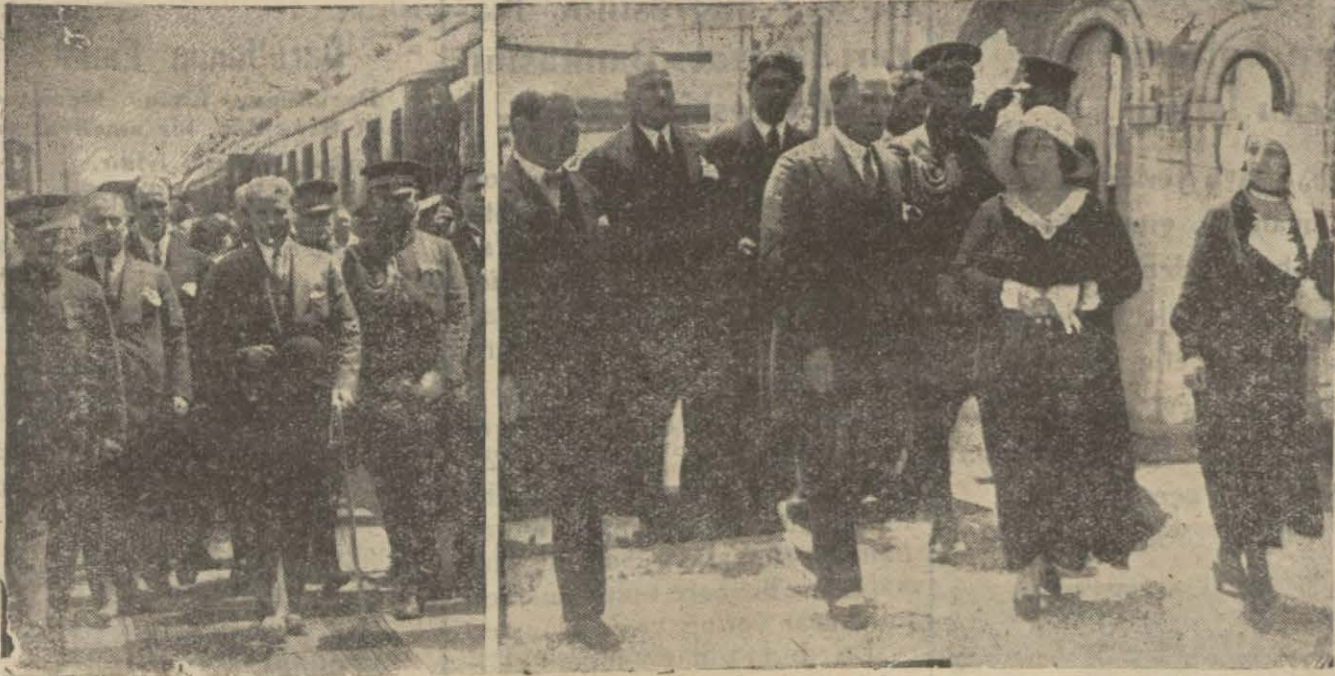
Gazi Hazretlerinin şehrimizi teşriflerine ait intibalar