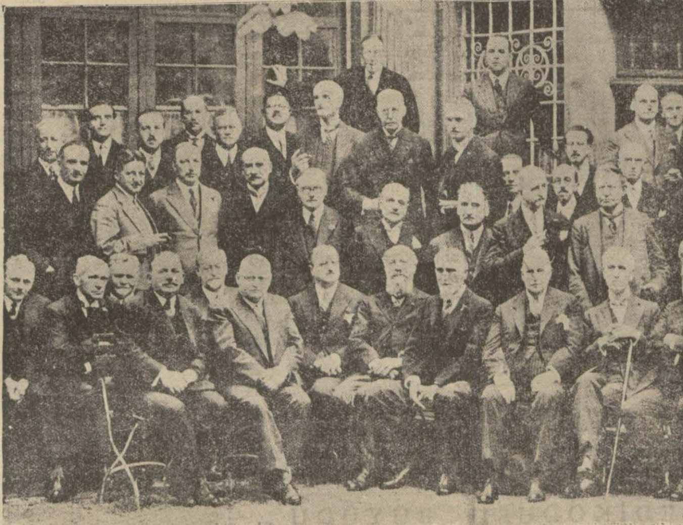
Alman vaziyetini ilk tetkik eden heyet: baldeki beynelmil bankası erkânı

Alman buhranından doğan ihtilâflı vaziyete dair Londra Paris ve Berlinden dün gelen telgrafların hulâsası şudur: